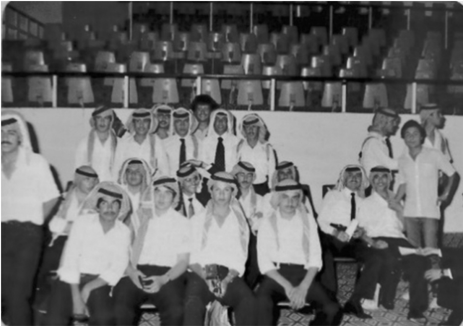
صور للزملاء الخريجين والحضور في حفل التخرج / 1982