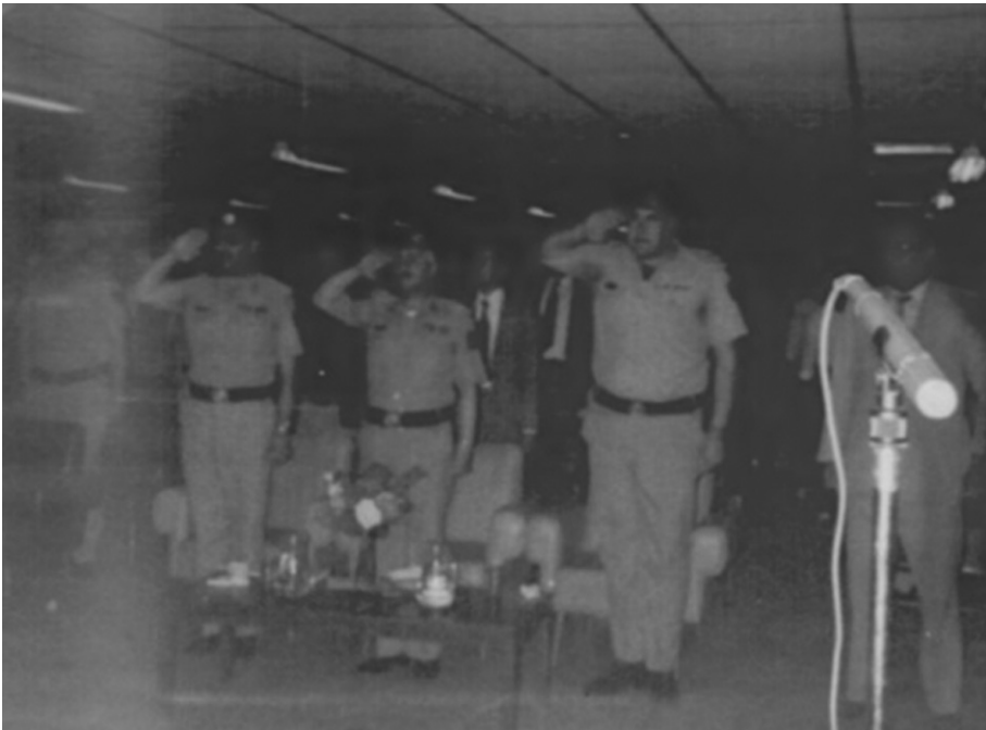
صور للزملاء الخريجين والحضور في حفل التخرج / 1982