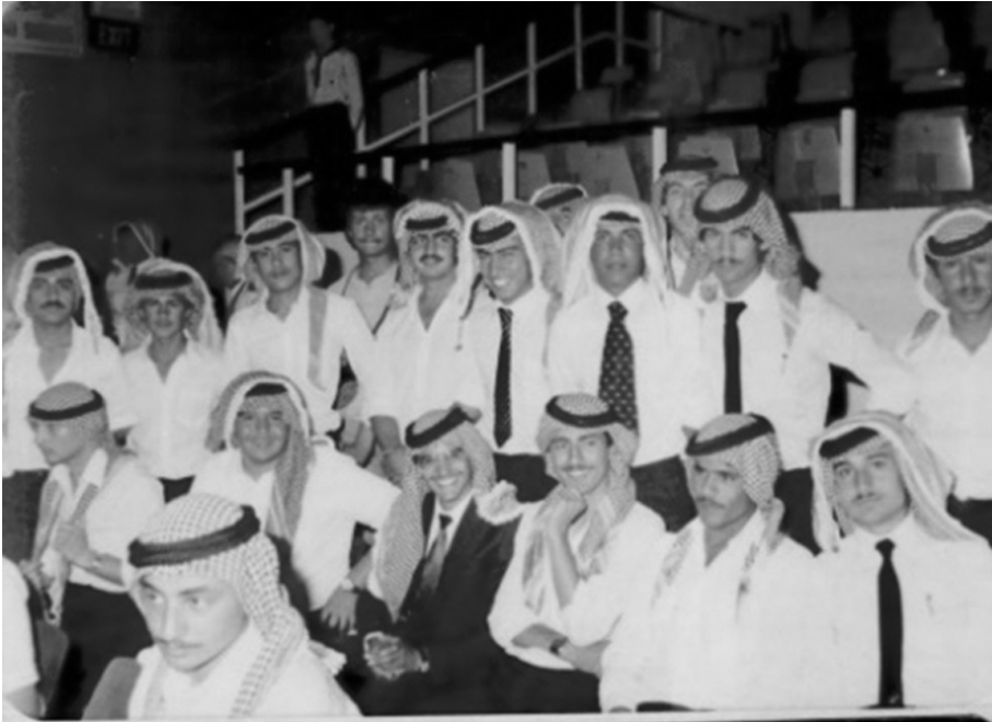
صور للزملاء الخريجين والحضور في حفل التخرج / 1982