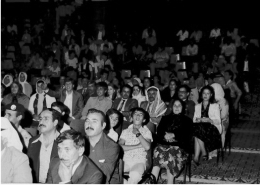
صور للزملاء الخريجين والحضور في حفل التخرج / 1982