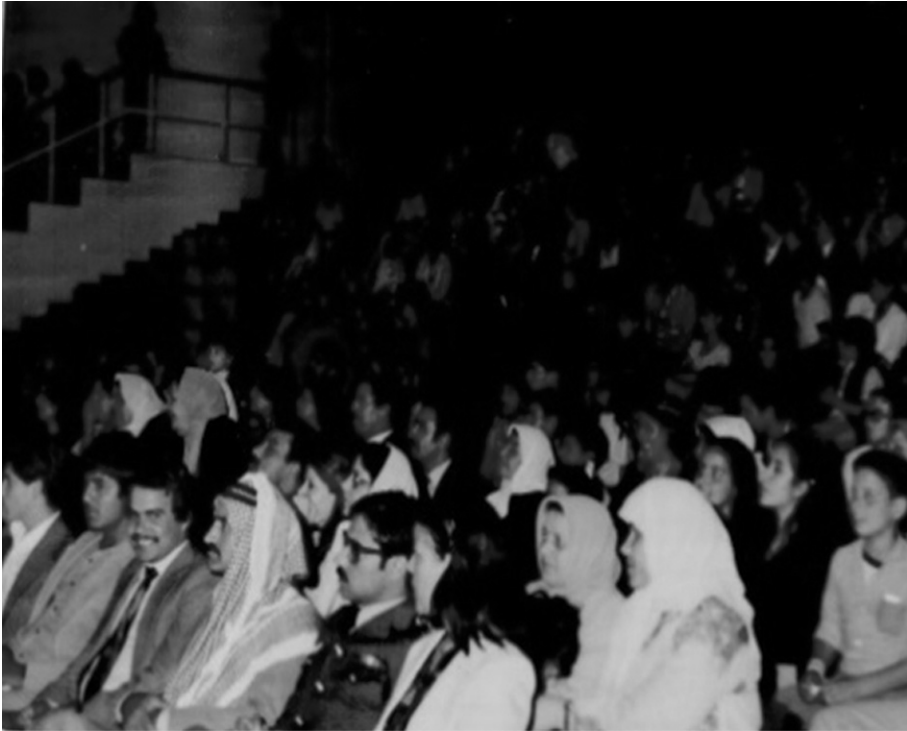
صور للزملاء الخريجين والحضور في حفل التخرج / 1982